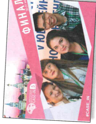
Команда «Дружба народов» — победитель направления «Геолого-разведка». Впереди у ребят финал Всероссийского чемпионата в Москве

место в лиге геолого-разведки, но при этом мы приобрели новые знания. В частности, моя специальность — гидрогеология, а задание было связано с разработкой плана геолого-разведочных работ золотого-сурьмяного месторождения в Красноярском крае. В итоге нам удалось попробовать себя в рудной геологии и тем самым расширить свой кругозор. Я благодарен за конструктивную критику экспертов, которые указали нам на ошибки.