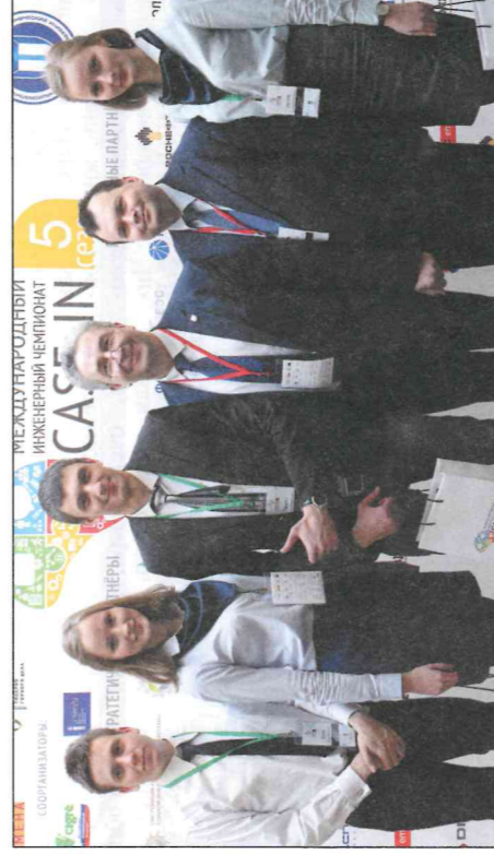
Команда «Энерджи» — победитель лиги «Электроэнергетика» — выдвинула нестандартную идею. Студенты предложили использовать в качестве источника энергоснабжения биогазовую установку, которая комплексно решает вопросы как снабжения так и экологии

В этом году в ИРНИТУ соревновались 20 команд. В каждой — от четырех до пяти участников. Примечательно, что многие студенты и аспиранты грядут желанием стать частью какой-либо команды. Это и не удивительно, ведь победители финального тура, как правило, получают предложения о трудоустройстве от крупнейших отраслевых компаний страны. По сути — на итоговом соревновании идет кадровый отбор.